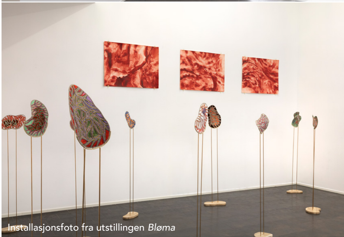
Installasjonsfoto fra utstillingen Bløma