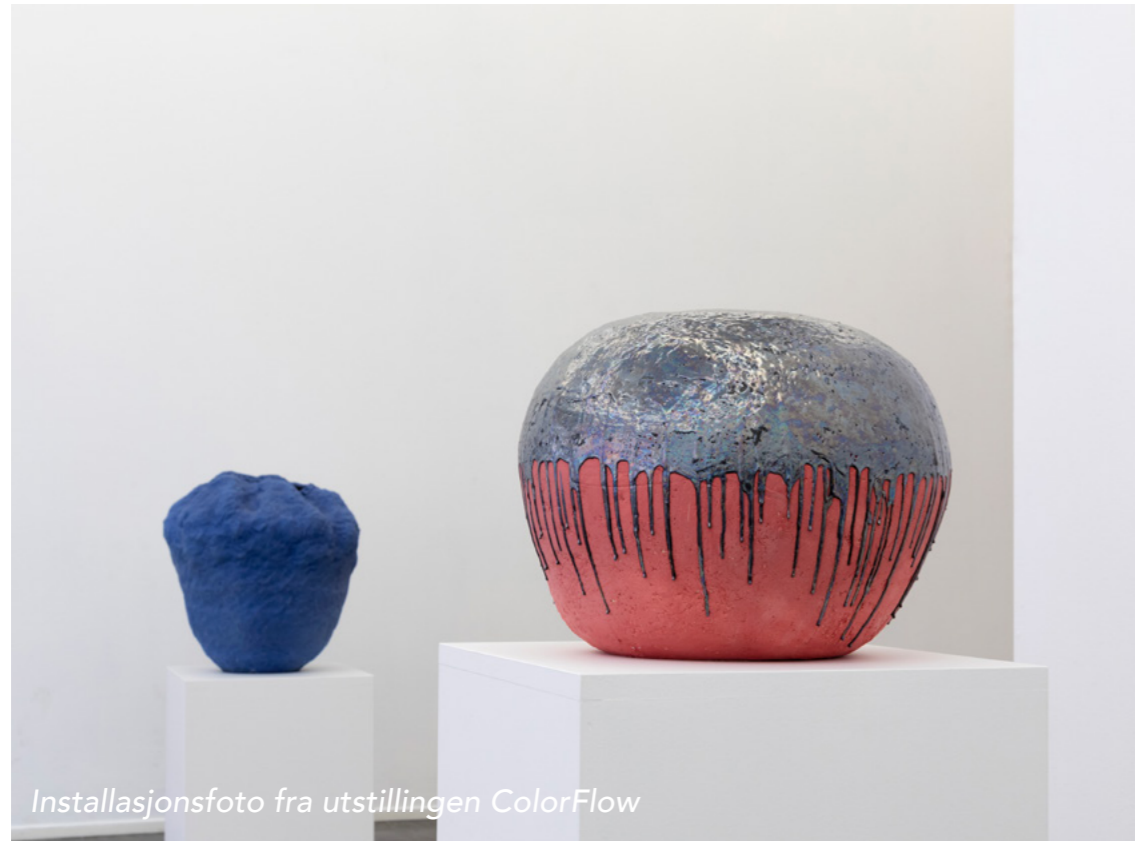
Installasjonsfoto fra utstillingen ColorFlow