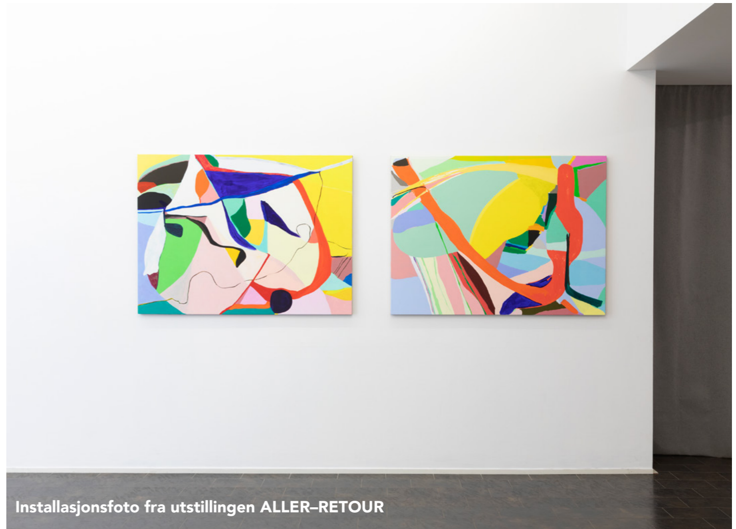
Installasjonsfoto fra utstillingen ALLER-RETOUR