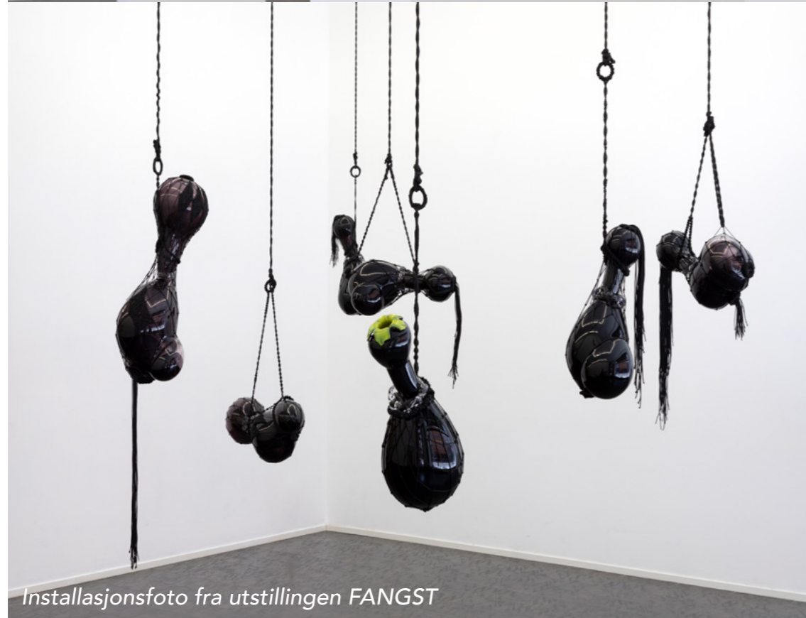
Installasjonsfoto fra utstillingen FANGST