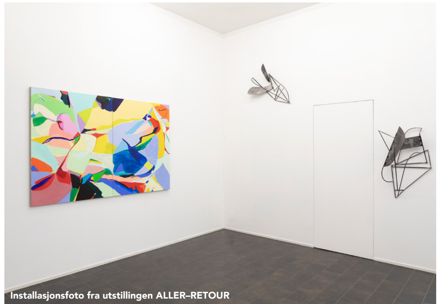
Installasjonsfoto fra utstillingen ALLER-RETOUR