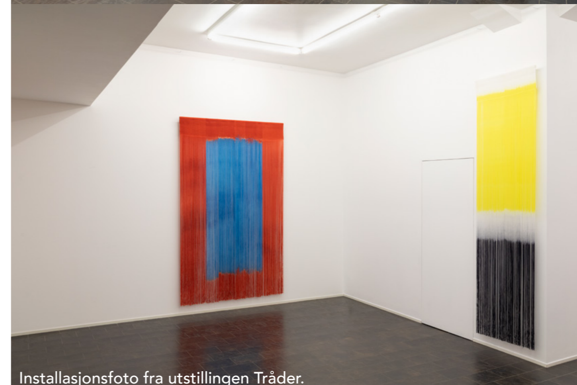
Installasjonsfoto fra utstillingen Tråder.