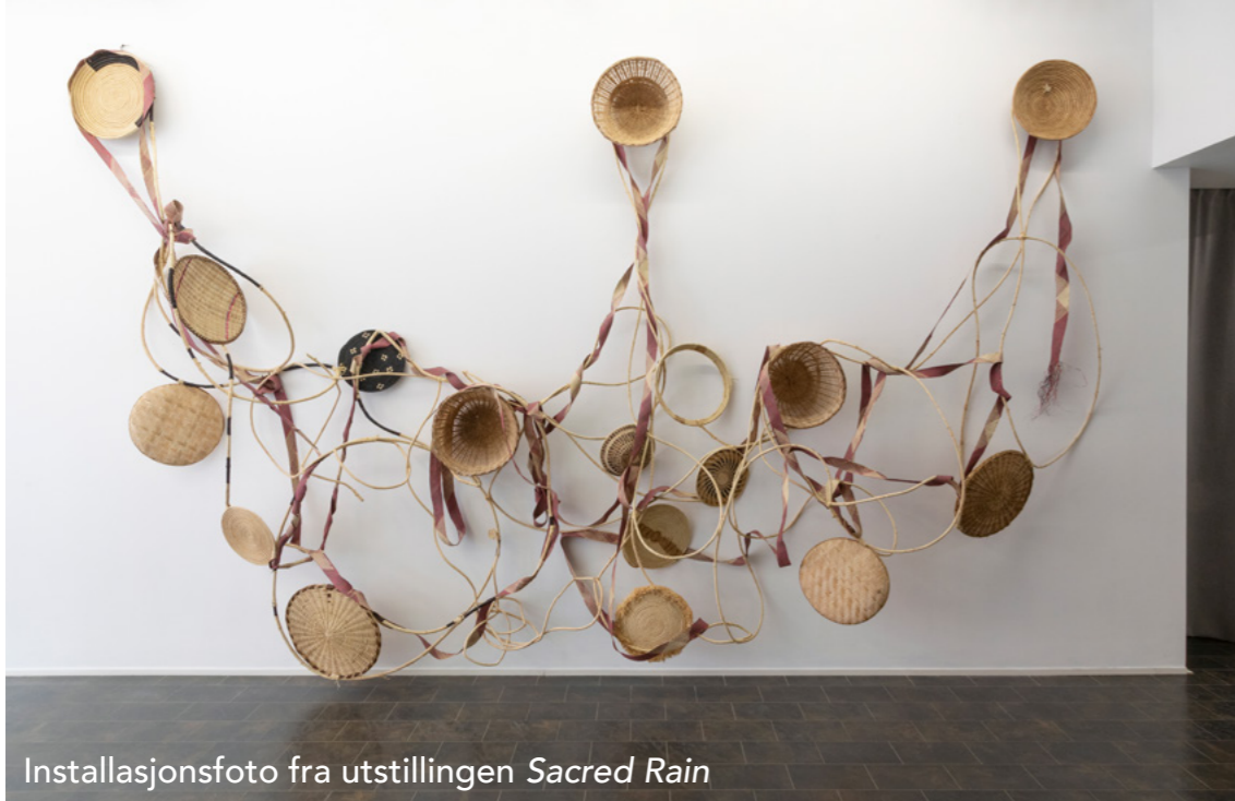
Installasjonsfoto fra utstillingen Sacred Rain