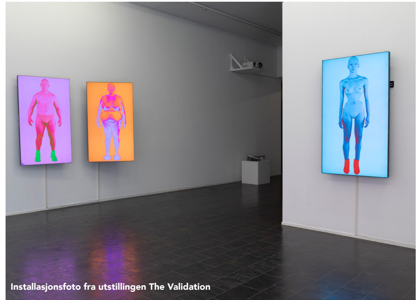
Installasjonsfoto fra utstillingen The Validation

Utstillingen ble fulgt av et omfattende formidlingsprogram med workshops for ungdom, offentlige omvisninger og kunstnersamtaler.