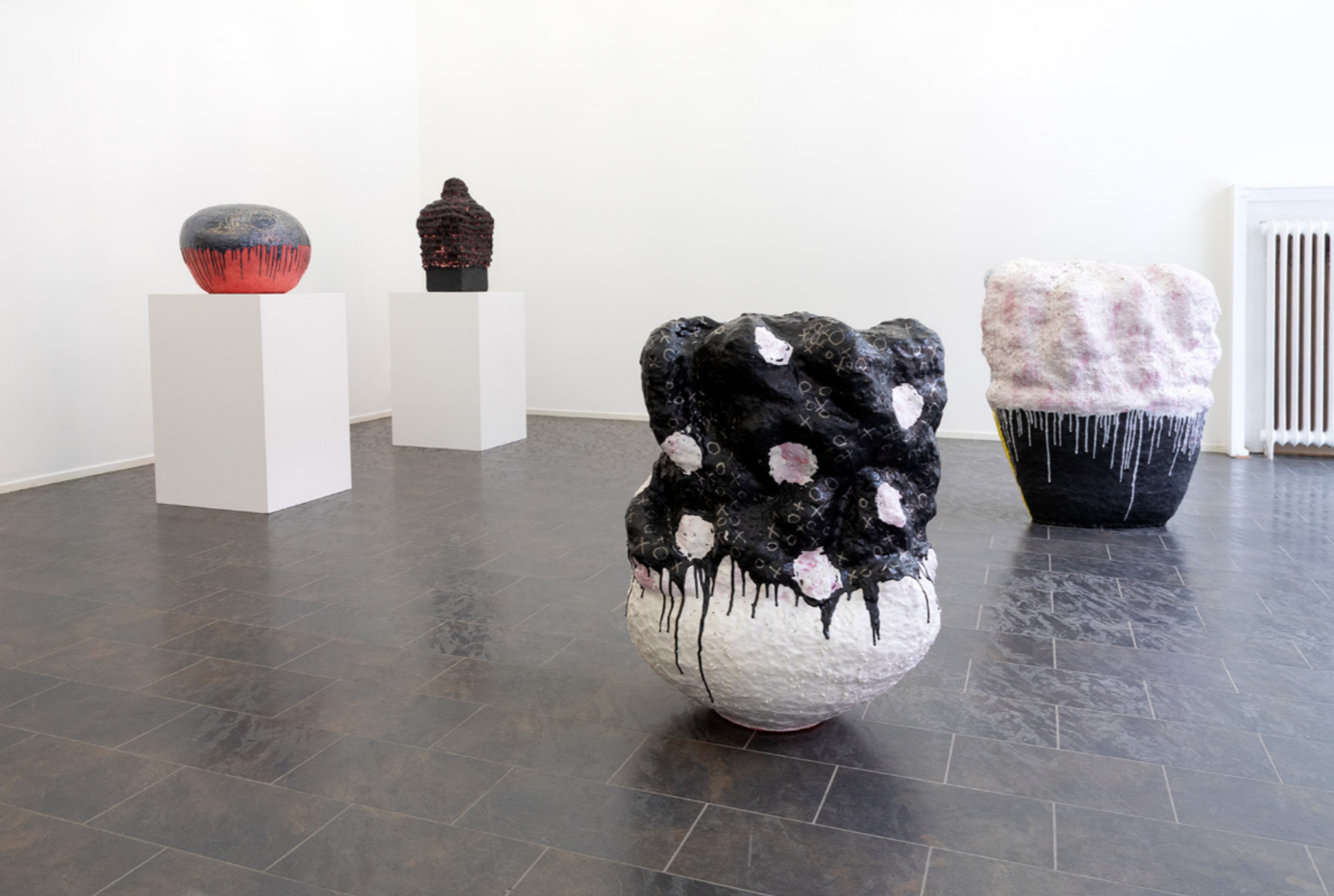
Installasjonsbilde fra utstillingen Takumi Morozumi: ColorFlow.