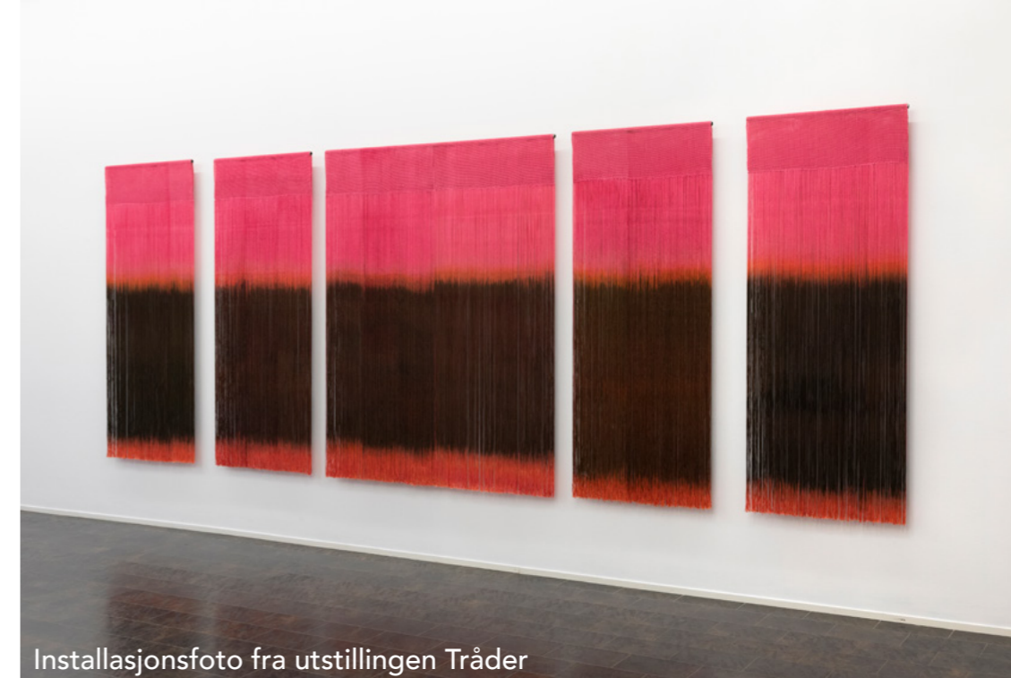
Installasjonsfoto fra utstillingen Tråder