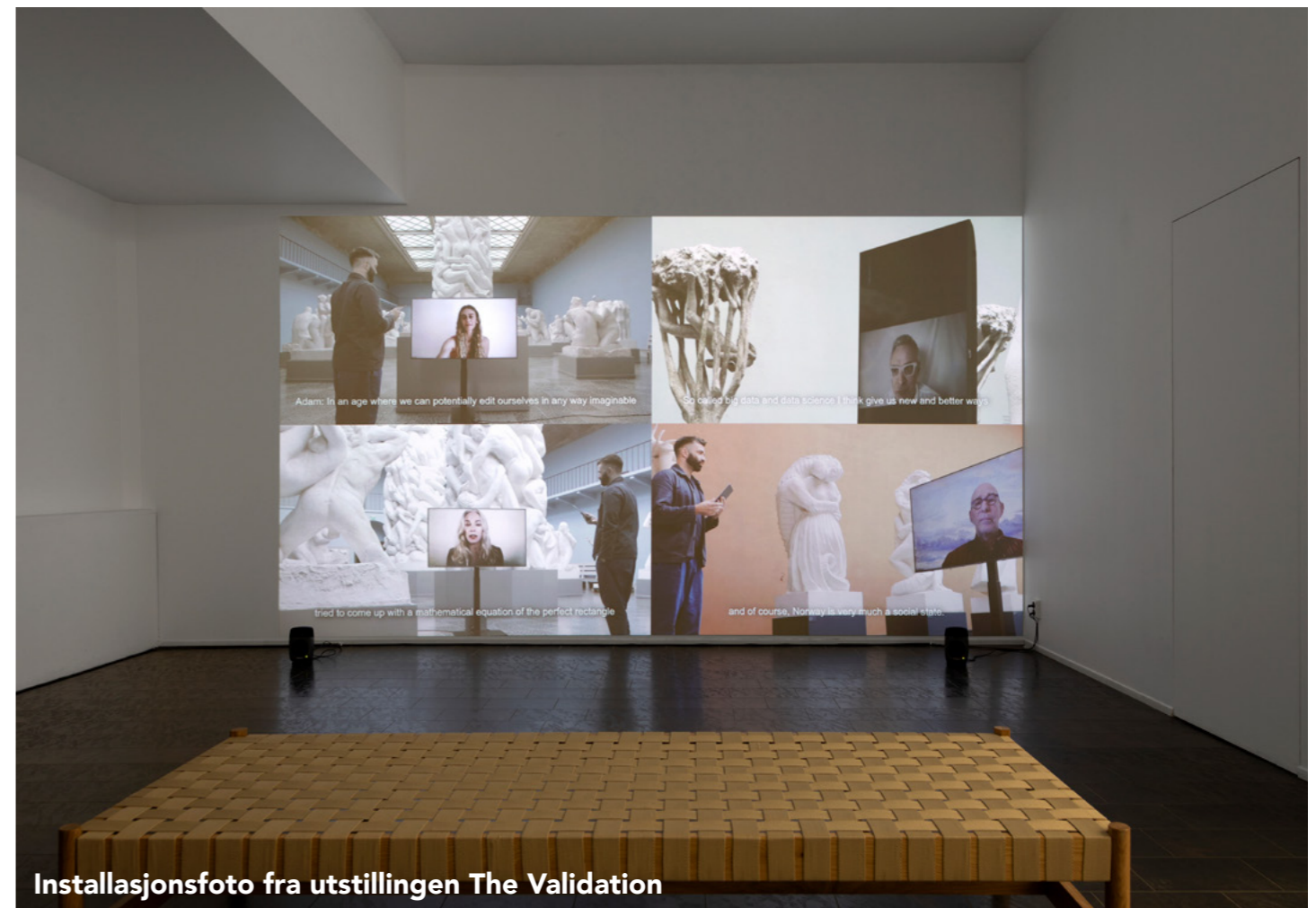
Installasjonsfoto fra utstillingen The Validation