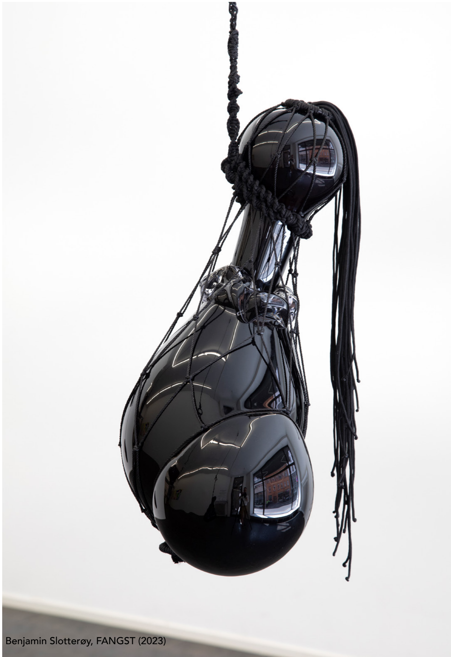
Benjamin Slotterøy, FANGST (2023)