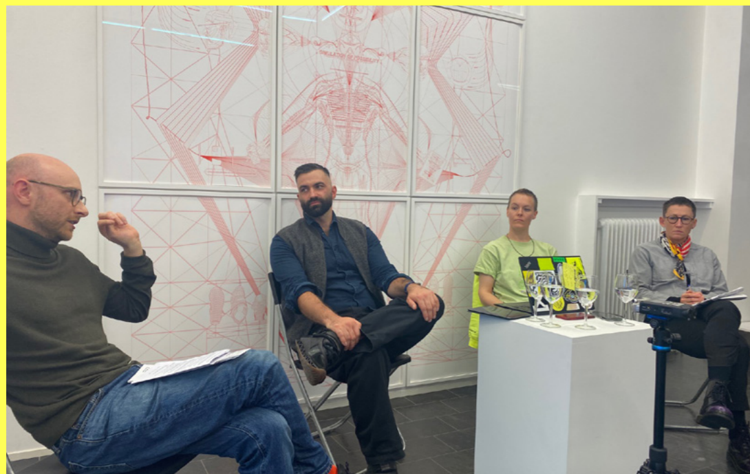
Panelsamtale i The Validation Junky.