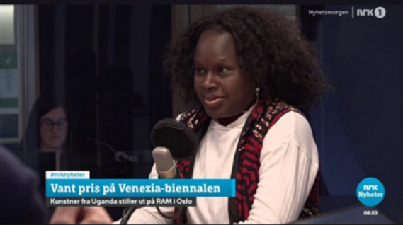
Vant pris på Venezia-biennalen