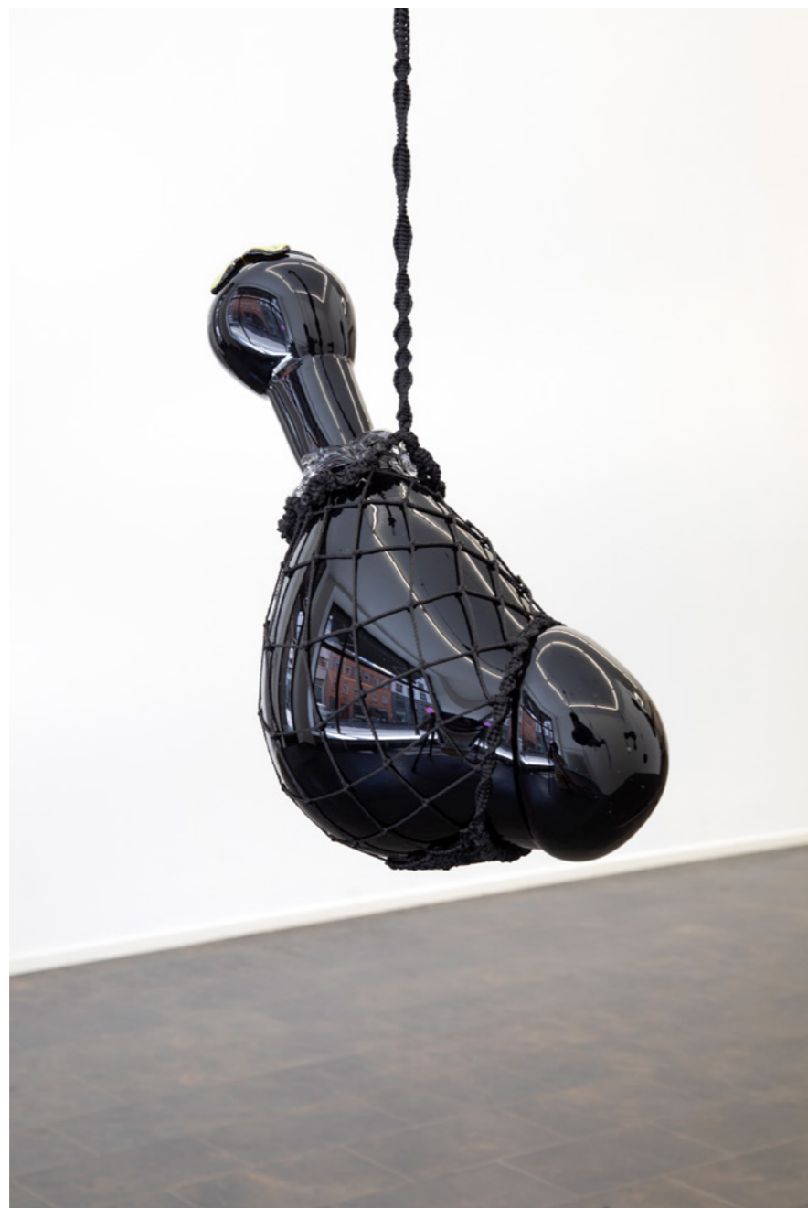
Benjamin Slotterøy, FANGST (2023).

Fra utstillingen FANGST 17. august – 23. september 2023.