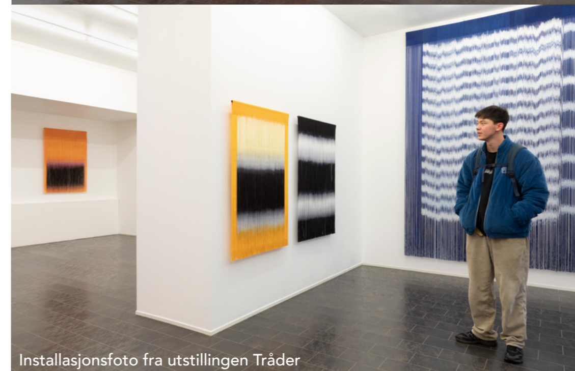
Installasjonsfoto fra utstillingen Tråder