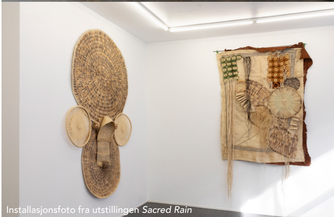
Installasjonsfoto fra utstillingen Sacred Rain